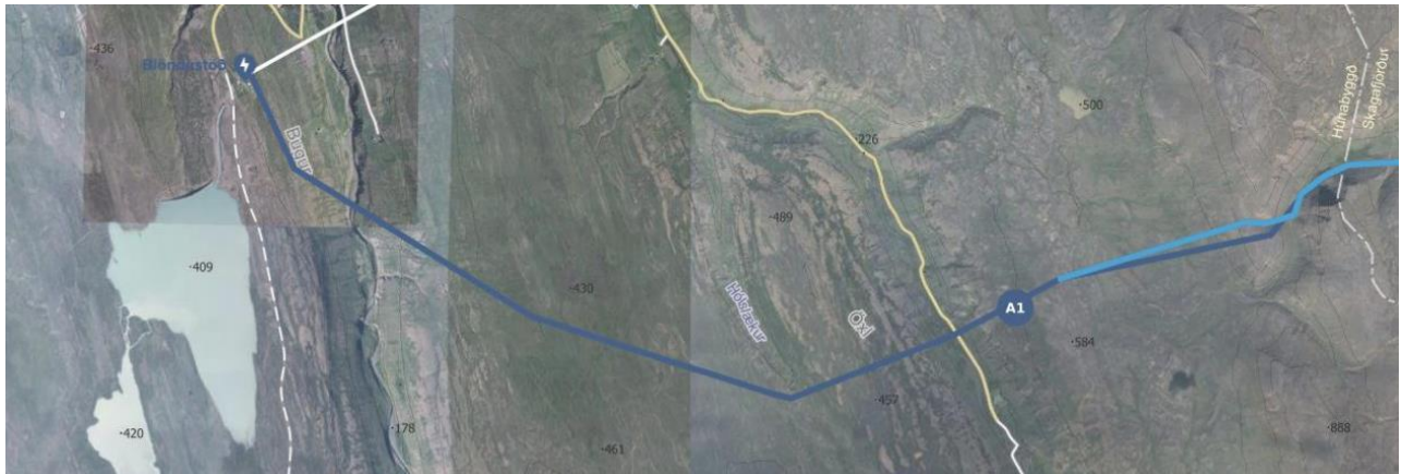
Mynd 1. Ilega Blöndulínu 3 frá Blöndustöð að sveitarfélagamörkum, ljósbláa línan táknar þá breytingu sem varð á legu línunnar eftir samráð við hagsmunaaðila.